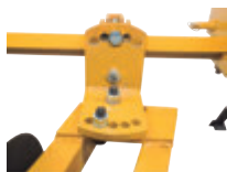
Angulación e Inclinación Con 5 puntos para diferentes configuraciones.