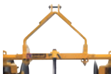
Enganche 3 puntos Cat II.