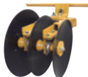
Discos De 22 in, 24 in y 28 in que permiten levantar bordos más altos.